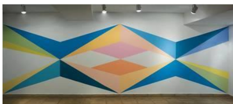
Cosas transparentes. De Carla Bertone, en la muestra comprendida en “Enlazar”

En “Enlazar”, tal el nombre del primer piso de la muestra, se pueden ver las obras de Bertone. Cuadros y esculturas en las que el marco se vuelve el elemento más importante, en tanto único soporte de una pintura de gradaciones sutiles y precisión geométrica, como ensayo de respuesta a la pregunta: ¿de qué forma hacer visible la transparencia?